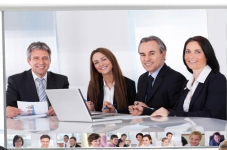
YCHAIN DCS1350 USB主管型高靈敏收音網路會議機

YCHAIN DCS1350 是一款高靈敏收音網路會議機，採用觸摸按鍵和手勢控制，具備反向音量控制功能 ( USB HID )。此外，只需要一條 USB 線即可輕鬆召開會議。